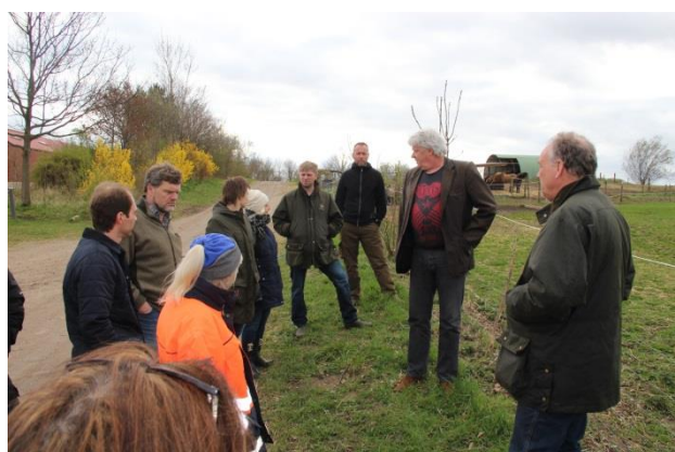
Brugerrådsmøde april 2014