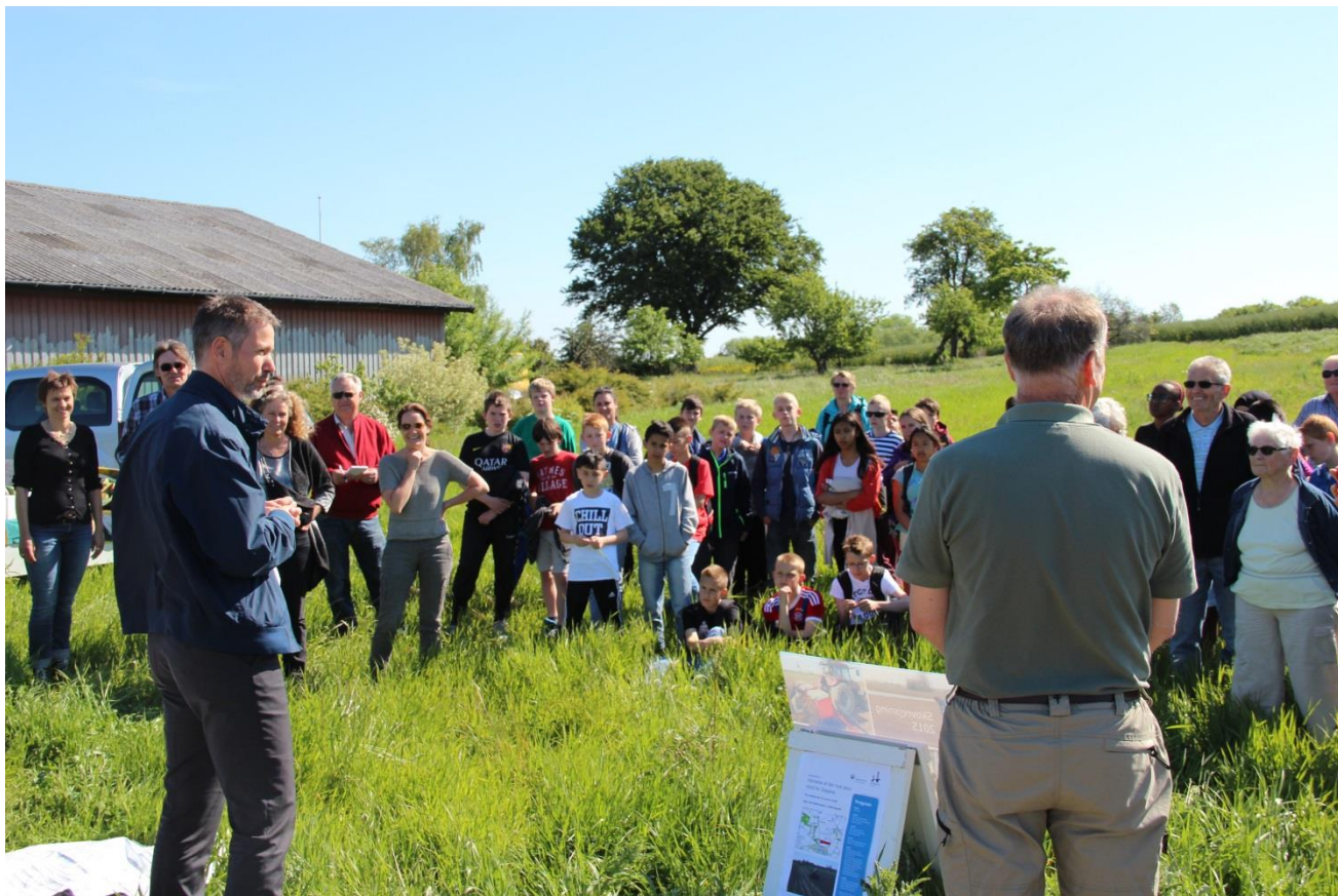
Nordskoven indvies d. 10. juni 2015