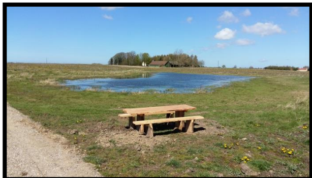
Det nordvestlige vådområde i Stenageren 2015

toper, jo flere forskellige slags planter og dyr og dermed større biodiversitet.