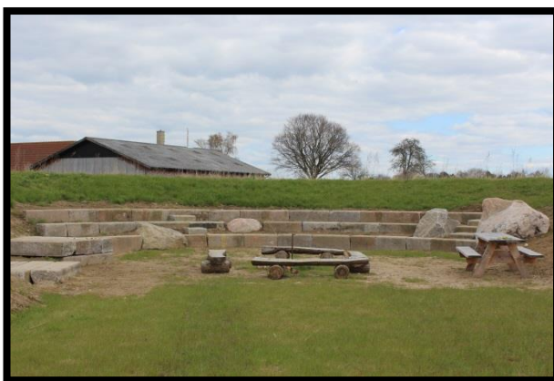
Samlingssted med bålpads 2017

Stenene på samlingsstedet er dels natursten og dels bordursten, som er store firkantede granitsten. Samlingsstedets bordursten er genanvendt fra Korsørs nu nedlagte færgehavn, hvor de blev brugt som kajkant.