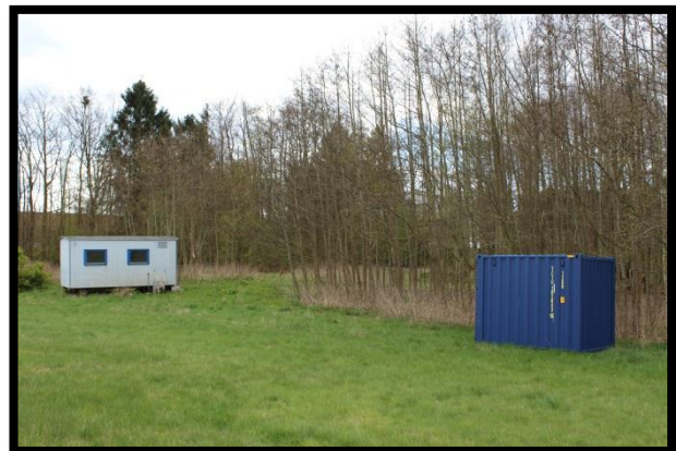
Grejbank og skurvogn 2017

I forbindelse med Rosenkildeskoven har der været en arbejdsgruppe med deltagelse fra Autisme Center Vestsjælland og Specialcenter Øst. Arbejdsgruppen er kommet med idéer og ønsker til området, så behovene hos målgruppen kan imødekommes.