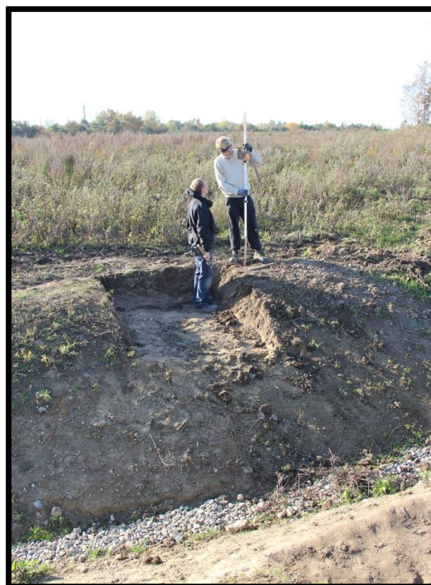
Elever fra Erhvervsskolen Selandia måler ud til en bro over grøften 2015

Jorden til samlingsstedet kommer den udgravede grøft, der blev lavet, da drænrørene blev fjernet. For at øge biodiversiteten er der lagt sten i bunden af grøften.