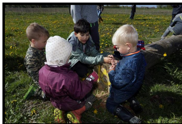
Børn fra Skovbørnehuset og Nymarkskolen samarbejder om at indrette insektboliger 2016

Børn fra Skovbørnehuset og Nymarkskolen var med til at indrette og indvie hotellets "lejligheder" - små huller i enden af stammerne blev fyldt med græs, pinde, blade og lignende, så insekter eller andre smådyr fik et sted at være.