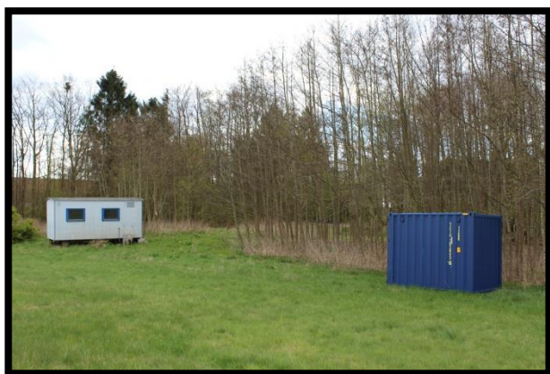
Grejbank og skurvogn 2017

Rosenkildeskoven er her i foråret 2017 ved at blive plantet til. I Rosenkildeskoven er Nordskovens grejbank og skurvogn placeret. Grejbanken indeholder grej til undersøgelser af naturen, blåmad, legeting til gamle lege, ting til undervisningsforløb og skrive/tegneunderlag. Grejbanken vedligeholdes af et aktiveringsprojekt under jobcenteret.