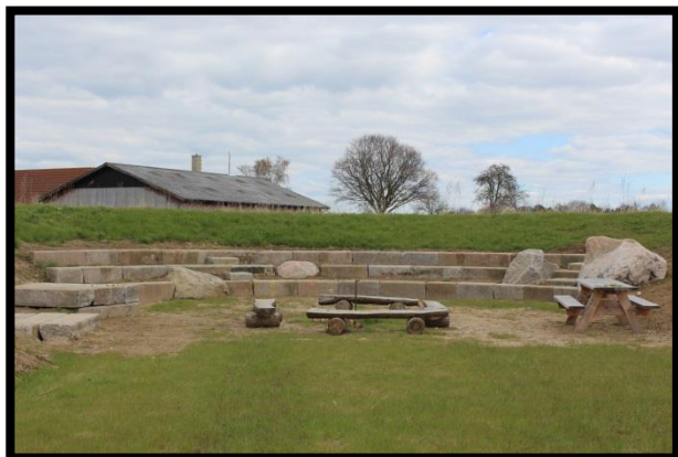
Samlingssted med bålplads mv.

Ved projekteringen af Børneskoven blev dagplejere, børnehaver og skoler involveret, så området kunne benyttes bedst muligt til oplevelser, undervisning og formidling. Dette arbejde førte til anlæggelsen af et samlingssted, en grøft og et insekthotel.