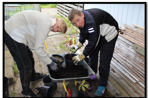
Omplantning af træer i kolonihaven 2017