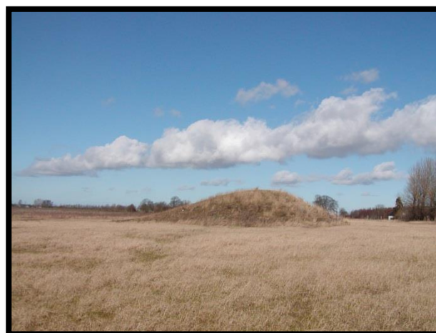
Kælkebakken på Stenageren 2017

En kælkebakke, som Nordskovens brugeråd ønskede, er placeret i et åbent område ved parkeringspladsen. Området kan bruges til forskellige lege og fysiske aktiviteter, som der kan lånes udstyr til i en grejbank opstillet nær ved i Rosenkildeskoven.