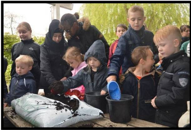
Børn fra Rosenkilde Børnehave og Nymarkskolen sår frø til Nordskoven 2015

For at Nordskoven kunne bruges aktivt af børne- og undervisningsinstitutioner fra begyndelsen, har dagplejebørn, børnehavebørn og nogle af Nymarkskolens elever sået fyr, bøg og eg.