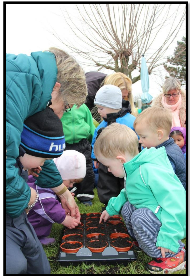
Børn i dagpleje sår frø til træer til Nordskoven 2015

De små træer - af nogle elever kaldt babytræer - skal plantes i Rosenkildeskoven, som led i Genplant Planeten i november 2017.