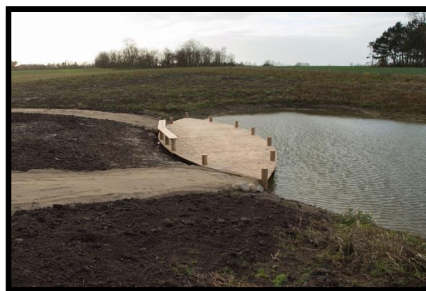
Platform ved sø Stenageren 2015

Derudover er der tre vådområder på Stenageren. Ved det ene - en lille sø i den sydlige del - er der bygget en platform med bænk. Her kan man sætte sig og opleve søens liv, hygge med mad og drikke eller bare holde et hvil.