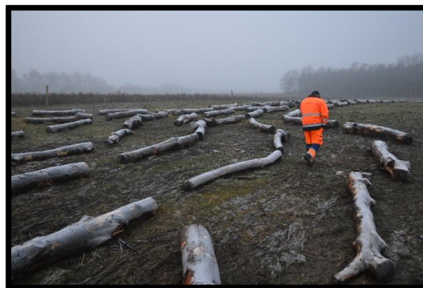
Insekthotellet Ask Yggdrasil anlægges 2015

I 2016 blev verdens måske største insekthotel placeret på et lysåbent område i Børneskoven.