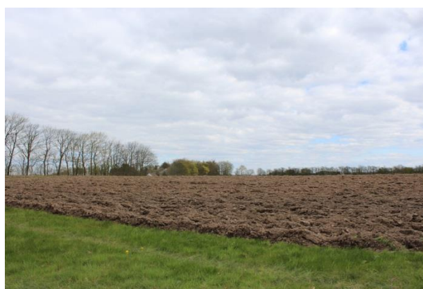
Rosenkildeskoven før plantning 2017