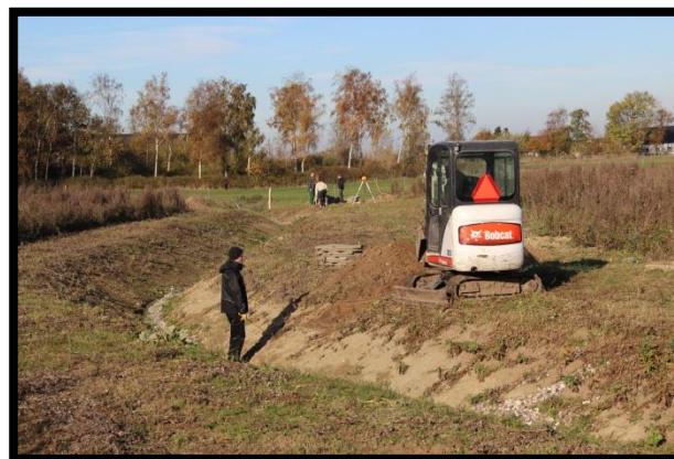
Grøften i Børneskoven graves af elever fra Erhvervsskolen Selandia 2015

Erhvervsskolen Selandia inddrager Nordskoven i deres uddannelsesforløb. Eleverne har bl.a. udgravet grøften, bygget broer over grøften og anlagt samlingsstedet i Børneskoven.