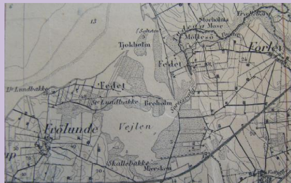
Historisk kort fra 1866 ( www.naesbystrand.dk )

Mellem 1866 og 1892 er området blevet inddæmmet og har fået den form, som vi kender i dag. Genopretningsprojektet er således ikke en genskabelse af den oprindelige lavvandede brakvandslagune, men mere skabelsen af et område med karakter af lavvandet sø/lavvandsområde/rørskov/fugtig eng.